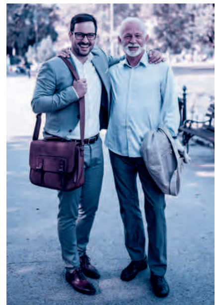
Finanzierung nach dem Umlageverfahren: zuerst einzahlen, später beziehen.