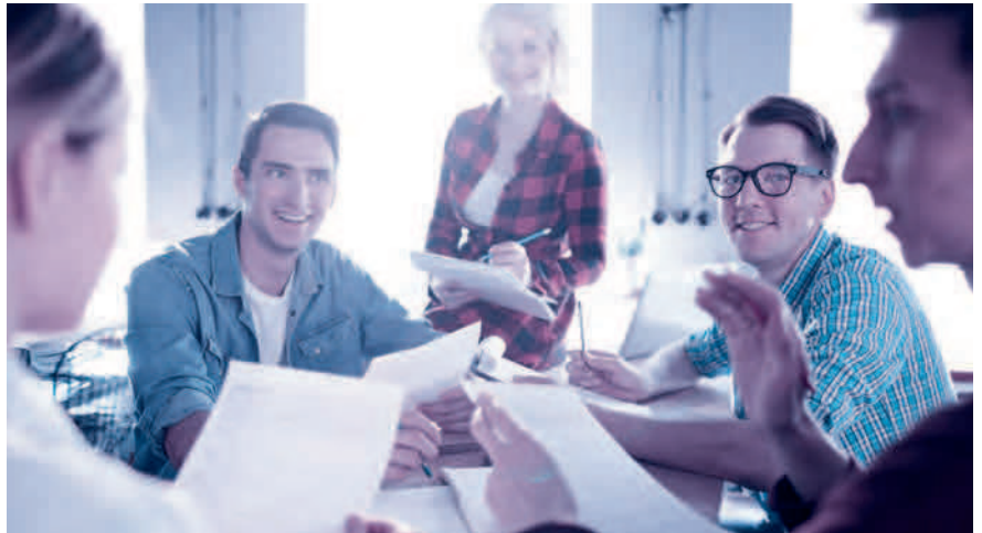
Aktionärbündungsvertrag: ein sinnvolles Instrument, um in guten Zeiten vorausschauende Regelungen für schwierige Phasen zu definieren.

Fast alle Aktionärbündungsverträge sehen Veräusserungsbeschränkungen vor, gerade in Familienbetrieben und Aktiengesellschaften mit wenigen Aktionären. Beispielsweise erwirbt man mit einem Kaufrecht das Recht, Aktien zu erwerben, ohne dass die Zustimmung der anderen Partei erforderlich wäre. Das kann sinnvoll sein, wenn ein Unternehmensaktionär bei der Gründung nicht das ganze Aktienkapital aufbringen kann, aber später den Anlegeraktionär auskaufen will. Vorhandrechte wiederum verpflichten dazu, seine Aktien der anderen Partei anzubieten, bevor ein Vertrag mit einem Dritten abgeschlossen wird. Ein Vorkaufsrecht berechtigt dazu, anstelle eines Dritten zu den Konditionen,