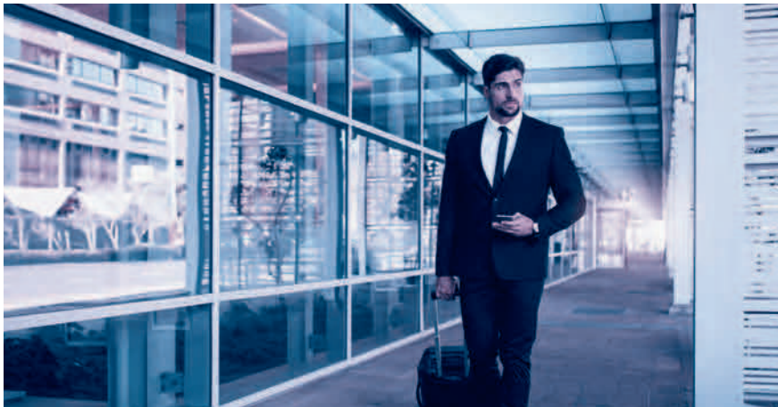
A1-Bescheinigung dabei? Sie ist für alle Aktivitäten im Ausland nötig.

entrichten hat. Es ist für sämtliche grenzüberschreitenden Tätigkeiten nötig, beispielsweise für Berater, Künstler, Journalisten oder Mitarbeiter im Transport oder Baugewerbe, und zwar auch dann, wenn der Aufenthalt nur wenige Stunden beträgt. Ausgestellt wird die A1-Bescheinigung von der AHV-Ausgleichskasse im Wohnsitzland des betroffenen Arbeitnehmers, beantragt wird sie vom Arbeitgeber des Entsandten bzw. direkt vom Selbständigerwerbenden.