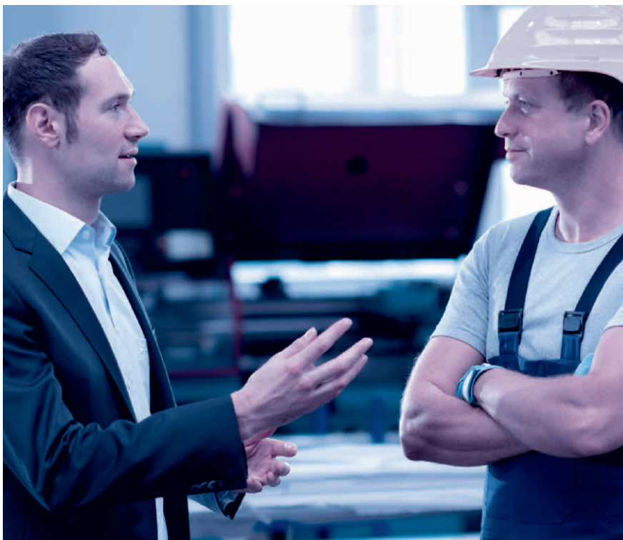
Das Mitarbeitergespräch ist keine Nebensache. Nehmen Sie sich Zeit und hören Sie zu.

Sinnvollerweise wird für das Mitarbeitergespräch zudem ein über die Jahre gleichbleibender Beurteilungsbogen mit einer Bewertungsskala (mit Smileys, Ampeln, Zahlen oder Buchstaben) verwendet.